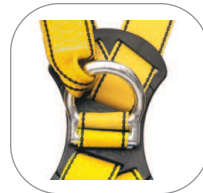
Punto de anclaje Dorsal