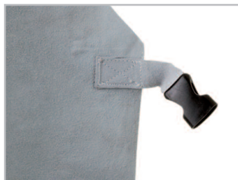
ENGANCHE RÁPIDO EN LA PARTE TRASERA