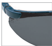
TSR ANTIVAHO OCULAR GRIS Ref. 10288