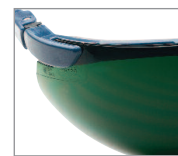
LENS IR5 FOR WELDING Ref. 10285