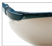
MIRROR LENS SILVER Ref. 10282